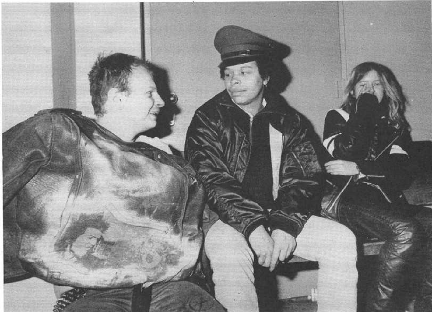
Jugendliche auf dem Sozialamt