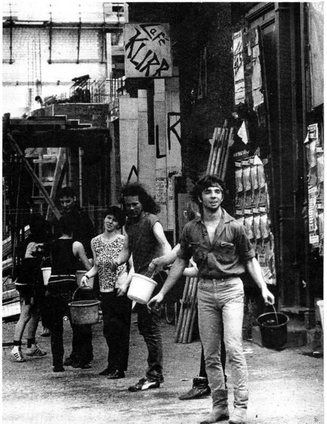
Jugendliche arbeiten an ihrem besetzten Haus in West-Berlin

zwar keineswegs gerecht, stellten den GRÜNEN aber zumindest Wahlkampf an den Schulen und Zensurmöglichkeiten via Finanzen sicher. Eine solche Jugendorganisation ist nicht mehr als ein Transmissionsriemen für die Partei und läßt für Selbstorganisation von Jugendlichen wenig Raum.