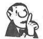
RECHTS EXTREME BUSFAHRER DÜRFEN NÄTURLICH FAHREN, WO SIE WOLLEN!