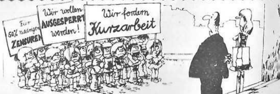
"Was haben wir nur in Wirtschaftskunde falschgemacht?"

Hinweis: Anzeigen und Beilagen entsprechen nicht der Meinung der Redaktion. Sie dienen ausschließlich der Finanzierung der Zeitung. Redaktionschluss für das Heft Nr. 1/80 ist der 31. 12. 1979