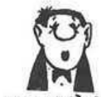
IMT ERGÄNZUNGSKLAUSUR ZUR RADIKALEN-ERLASS...